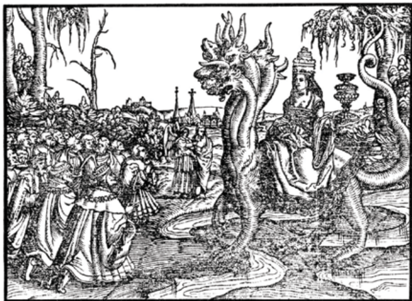
(De la traducción alemana de Lutero de 1534)

A medida que pasaba el tiempo, esta interpretación del Apocalipsis fue entendida por la gente. Con razón, las autoridades de la Iglesia Católica estuvieron preocupadas. Entonces así se hizo necesario que la Iglesia desarrollara su propia interpretación de Apocalipsis para combatir lo que se enseñaba al pueblo.